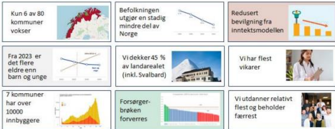
Figur 2 - Helse Nords særlige utfordringer

Helse Nords særlige utfordringer er illustrert i figuren under.