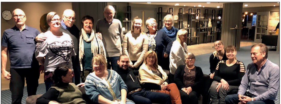
Regionalt brukerutvalg og representanter for ungdomsrådene og brukerutvalgene i foretakene var samlet i Bodø 11. november.