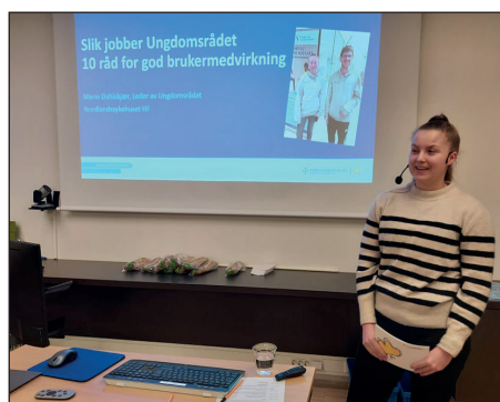
Bilder fra kurs for brukermedvirkere, gjennomført 9. november.